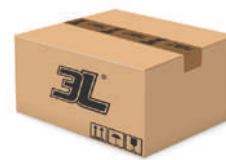
120 pares caja 120 pairs box