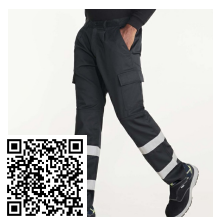
DAILY HV HV9307